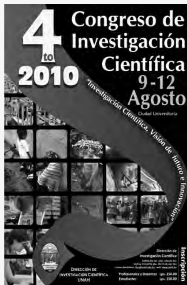
Jornada del tercer Congreso de Investigación Científica

Además, participarán los investigadores que deseen presentar avances o resultados de sus investigaciones, los que quieran validar proyectos de investigación, o debatir temas y problemas del quehacer académico vinculado a la investigación. ■